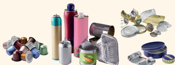
Les emballages en métal