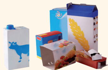
Les emballages en cartonnage

A déposer dans votre sac jaune, bac ou colonne