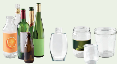
Bouteilles, pots, bocaux et flacons