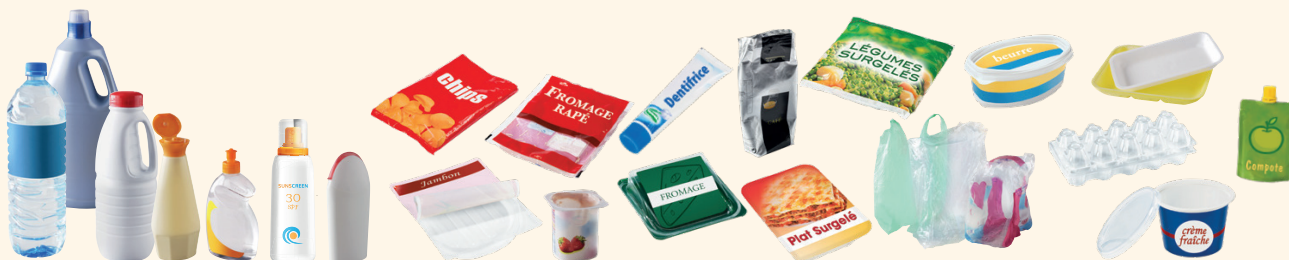
Les emballages en plastique