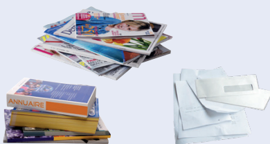
Tous les papiers à lire et à écrire