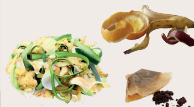
Epluchures de fruits et de légumes, pain, restes de repas, ...